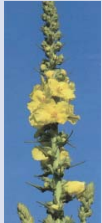
Königskerze ( Verbascum thapsiforme )