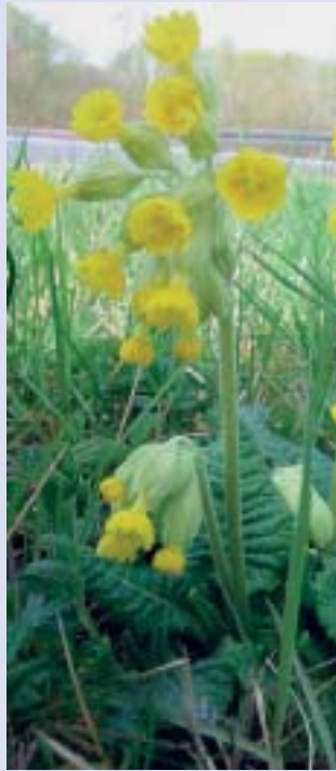
Primelwurz ( Primula officinalis )