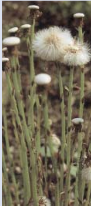
Huflattich ( Tussilago farfara )