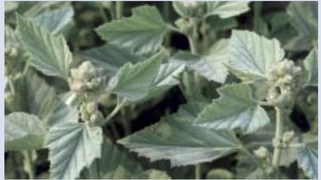
Eibisch ( Althaea officinalis )

Ähnlich wirksam ist Isländisch Moos ( Lichen islandicus ). Dieses Moos ist eigentlich kein Moos, sondern eine Flechte, also ein Zwitterwesen aus Pilzen und Algen. Es enthält Schleim