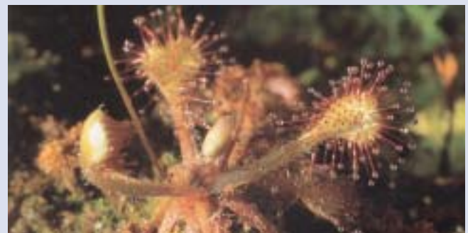
Sonnentau ( Drosera rotundifolia )

und Bitterstoffe, sowie Flechtensäuren, die eine deutliche antimikrobielle Wirkung besitzen. Die Heilpflanze wird vor allem bei chronisch-rezidivierendem Reizhusten eingesetzt. Besonders beliebt sind Lutschpastillen (Isla Moos Pastillen), vor allem bei Heiserkeit durch Stimmüberlastung (Redner, Sänger).