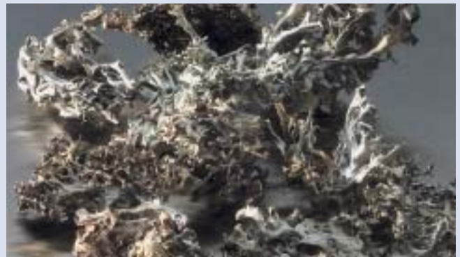
Isländisch Moos ( Lichen islandicus )