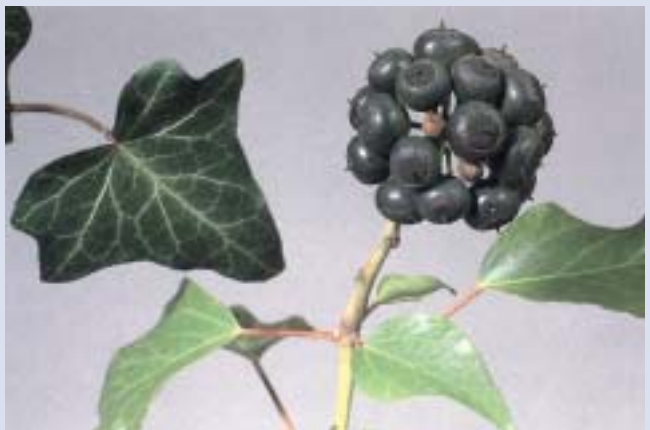
Efeu ( Hedera helix )

tolerabel. Die Pflanze enthält aber nur bis zu 0,01 Prozent der toxischen Substanz. Zur Bekämpfung des morgendlichen Reizhustens empfiehlt sich die Einnahme einer Teezubereitung vor dem Aufstehen.