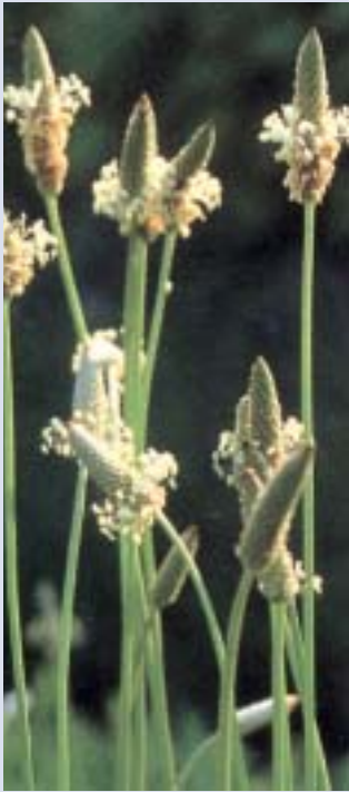
Spitzwegerich ( Plantago lanceolata )